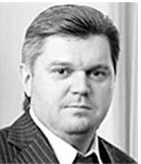
Міністр екології та природних ресурсів України СТАВИЦЬКИЙ Едуард Анатолійович ЄВРЕЙ

У минулому номері ми повідомляли, що серед десяти найвищих посадовців України немає жодного українця за національністю. Досліджуючи нижчі щаблі української влади, можна перекоонатися, що з 18-ти членів Кабінету Міністрів України українцями за походженням є лише третина - 6 осіб, котрі, до всього, мають не найвищі посади.