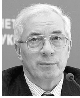
Прем'єр-міністр України АЗАРОВ (Пахло) Микола Янович. Народився у м. Калуга (Росія). ЄВРЕЙ.