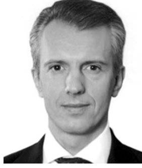
Перший віце-прем'єр-міністр України ХОРОШКОВСЬКИЙ Валерій Іванович. Народився у м. Київ. РОСІЯНИН.