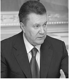
Президент України ЯНУКОВИЧ Віктор Федорович. Народився у м. Єнакієве Донецької обл. БІЛУРУС.

Українська республіканська партія не раз наголошувала на тому, що влада в Україні не належить українцям. Так, у Верховній Раді зараз лише 22% представників корінної нації. А серед ключових осіб, що займають найвищі посади у державі, також можна знайти лише представників нацменшин.