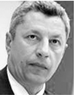
Міністр енергетики та вугільної промисловості України БОЙКО Юрій Анатолійович ЄВРЕЙ