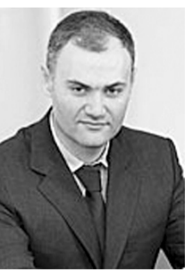
Міністр фінансів України КОЛОБОВ Юрій Володимирович РОСІЯНИН