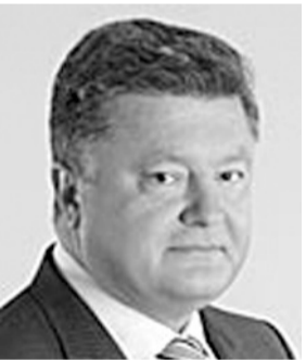
Міністр економічного розвитку та торгівлі України ПОРОШЕНКО Петро Олександрович ЄВРЕЙ