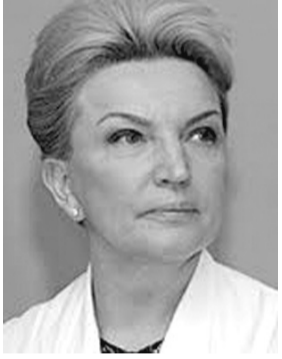
Віце-прем'єр-міністр України БОГАТИРЬОВА Раїса Василівна. Народилася у м. Бакал Челябінської обл. (Росія). РОСІЯНКА.