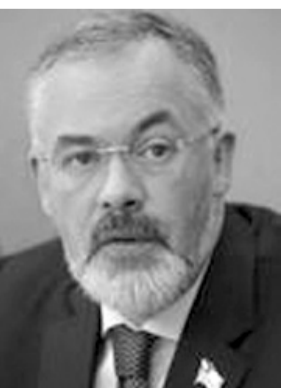
Міністр освіти і науки, молоді та спорту України ТАБАЧНИК Дмитро Володимирович ЄВРЕЙ