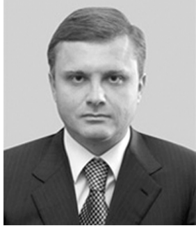
Голова Адміністрації Президента України ЛЬОВОЧКИН Сергій Володимирович. Народився у м. Київ. РОСІЯНИН.