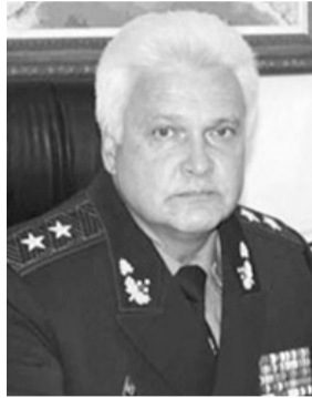
Голова СБУ КАЛІНІН Ігор Олександрович. Народився у Московській обл. (Росія). РОСІЯНИН.