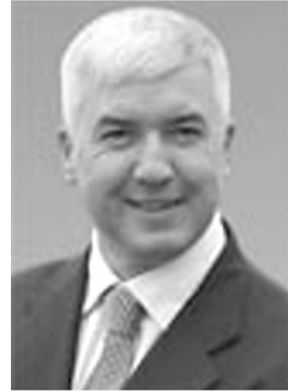
Міністр оборони України САЛАМАТІН Дмитро Альбертович. Народився у м. Караганда (Казахстан) РОСІЯНИН.

У минулому номері ми повідомляли, що серед десяти найвищих посадовців України немає жодного українця за національністю. Досліджуючи нижчі щаблі української влади, можна перекоонатися, що з 18-ти членів Кабінету Міністрів України українцями за походженням є лише третина - 6 осіб, котрі, до всього, мають не найвищі посади.