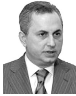
Віце-прем'єр-міністр України КОЛЕСНИКОВ Борис Вікторович. Народився у м. Маріуполь Донецької обл. ЄВРЕЙ.