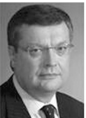
Міністр закордонних справ України ГРИЩЕНКО Костянтин Іванович ЄВРЕЙ