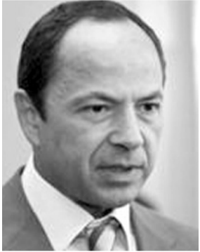
Віце-прем'єр-міністр України ТІГІПКО Сергій Леонідович. Народився у с. Драго-нешти Лазовського р-ну (Молдова). МОЛДАВАНИН.